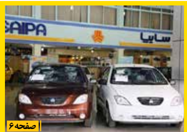
قائم مقام مدیرعامل سایپا پدک عنوان کرد ارتقای خدمات سایپا پدک

حتما لفظ «حبابی بودن بازار» را شنیده‌اید، شاید این اصطلاح باعث خنده شما هم شده باشد، اما آنچه باید مورد توجه قرار گیرد این است که رشد اقتصادی کشور ما منفی است و به‌طور طبیعی بازارهای گوناگون با حباب مواجه هستند. یعنی حجم معاملات بسیار بالاست اما... ادامه صفحه ۲